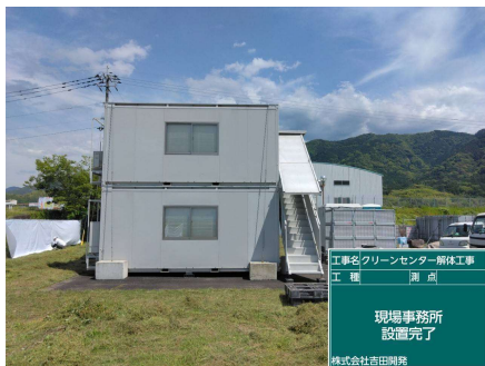
現場事務所設置完了