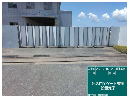
仮囲い・出入口ゲート 設置完了